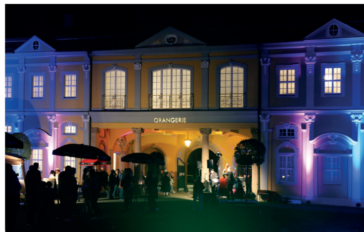
Kunstsammlung – Orangerie